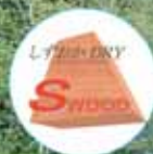
しずおか優良木材認証マーク

含水率基準について、木口の相違(厚さ)90mm以上の断面を有する構造用材に適用する。